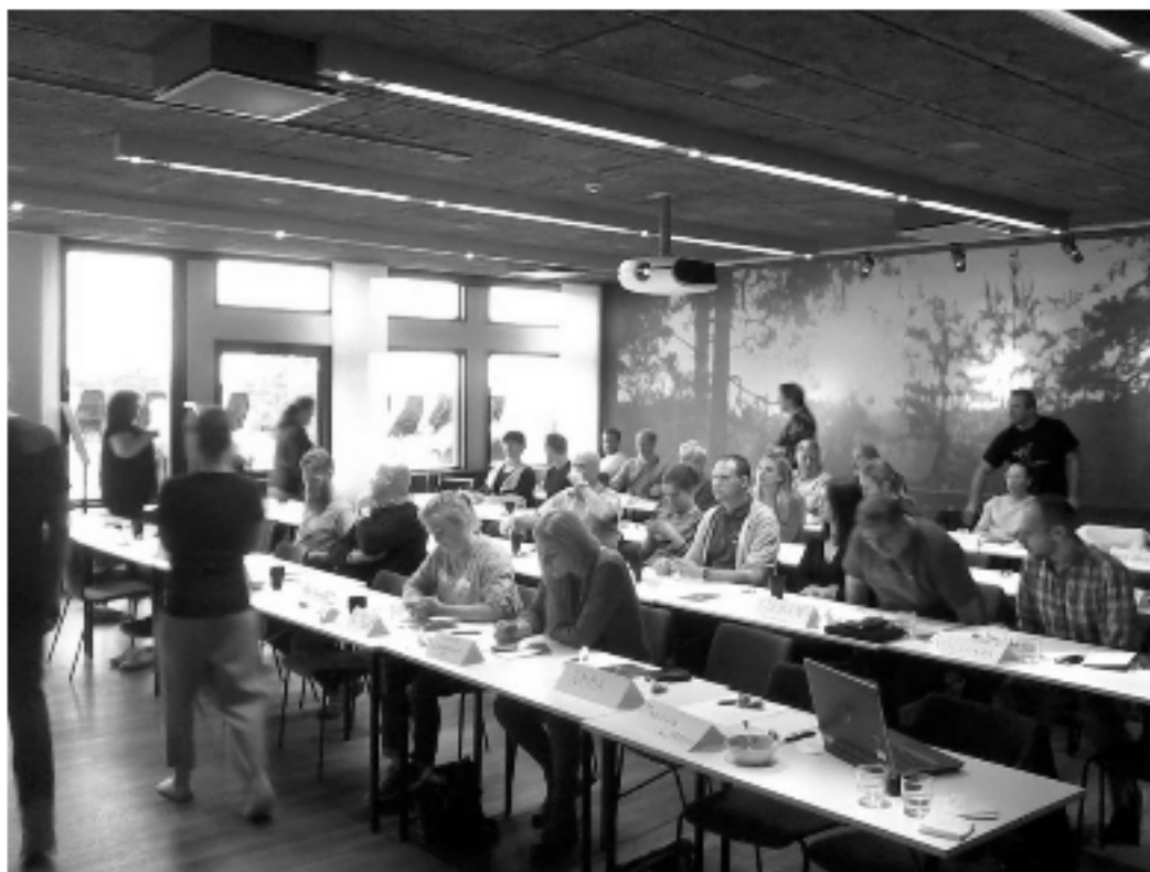
Bild från en av flera arbetshelger. Här har representanter från samtliga SB&Ks SDF (Specialdistriktsförbund som exempelvis SB&K Nedre Norr) samlats för att slå sina kloka huvuden ihop.

Styrelsen vill se mer engagemang från medlemsföreningarna, då det är dessa och inte styrelsen som är förbundet. Speciellt närvaron vid förbundsstämman är ett måste då styrelsen och distriktet inte kan fungera optimalt utan kontakt mellan medlemmarna och klubbarna i distriktet.