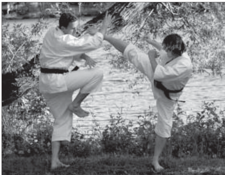
Shorinji kempo.

ägde rum i Lisebergshallen helgen 3-5 september. 127 deltagare från hela Sverige, Finland, Frankrike, England, Tyskland, Portugal, Italien, Ryssland och Japan kom för att tävla och träna tillsammans med fyra av de främsta instruktörerna inom Shorinji Kempo – Aosaka-sensei 8 dan, Kawashima-sensei 7 dan, och de två bröderna Morikawa, båda med 7 dan.