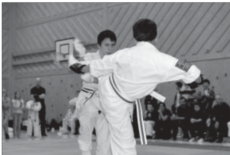
Skokloster Open.

ranter och tre domare på utbildningen som innehöll teori under ledning av shihan Naser Ghanbari och praktik under tävlingen.