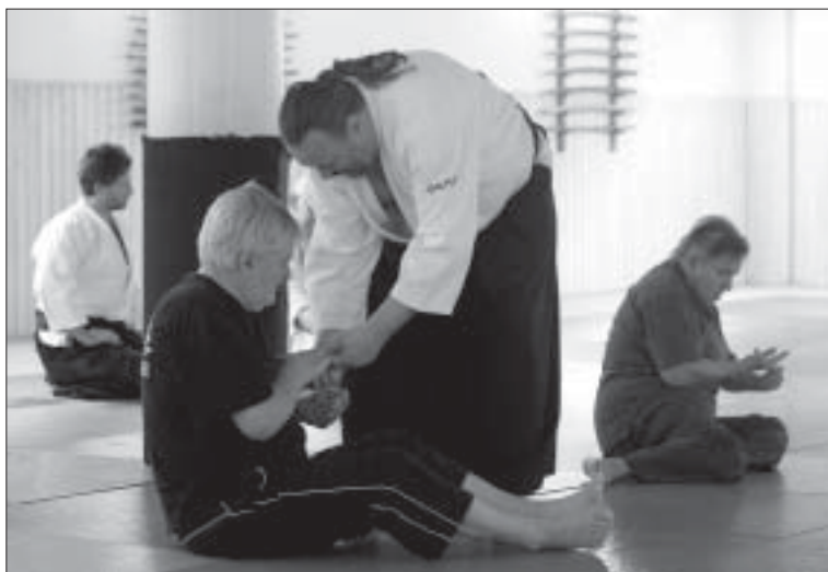
Aikido för strokepatienter på Iyasaka.

Gruppen samlas ihop. Träningen är över och allt eftersom lämnar deltagarna lokalen. Ut till livet igen. Med nyfunnet mod och hopp om en bättre framtid.