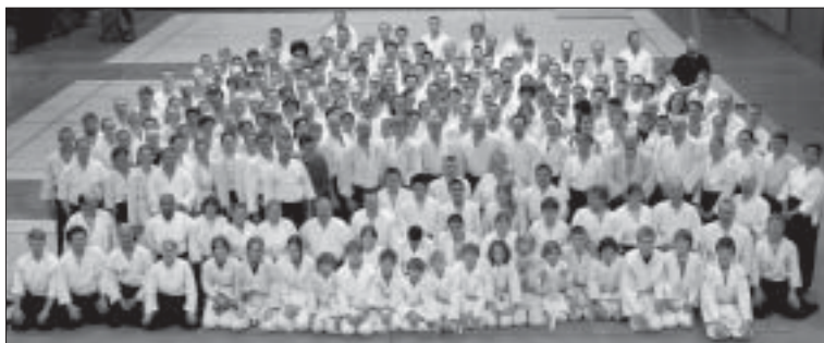
Deltagarna i Sverigelägret 2010 i Malmö.