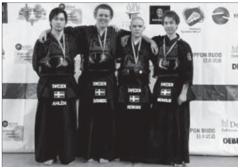
Det svenska juniorlaget vid kendo-EM.