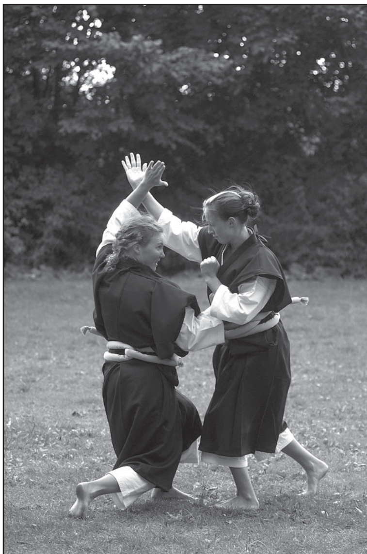
Shorinji Kempo.