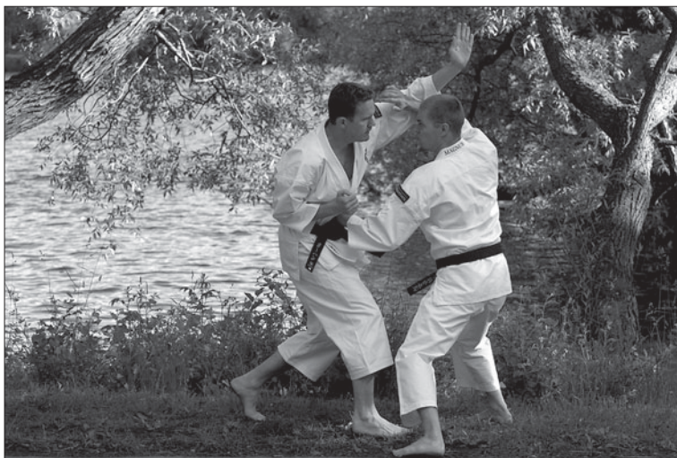
Shorinji Kempo.

högsta klassen som var 3 dan och uppåt och lyckades alltså besegra allt motståndet med sin embu , som de även sedan tidigare varit flerfaldiga svenska mästare med.