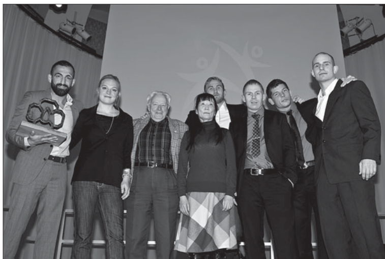
Pristagarna på Kampsportsgalan 2011.