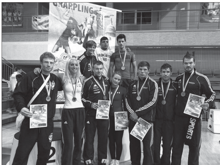
Landslaget vid EM.