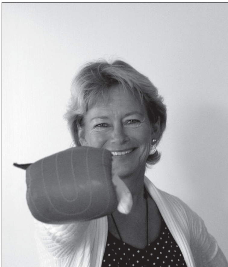
Idrottsminister Lena Adelsohn Liljeroth slår ett slag för kampsporterna.

– Vissa kampsporter kan se råa och farliga ut, men de flesta är kopplade till starka filosofiska värderingar och jag har hittills inte stött på en kampsportare som inte är ödmjuk och respektfull.