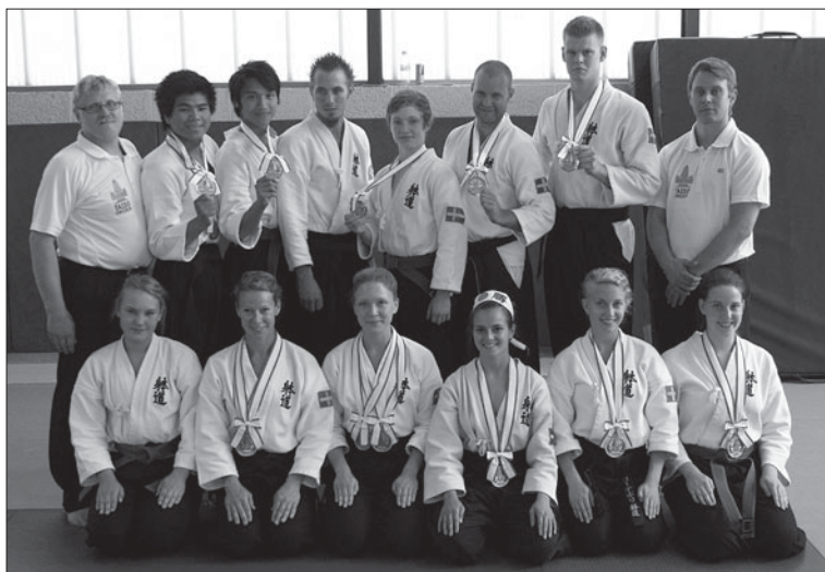
EM-laget i taido.