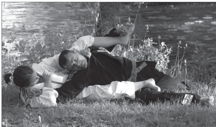
BJJ i gröngräset.

lande visade på hög nivå. Efter en avslutad tävlingsdag kunde vi kora ett antal nya mästare som belönades med RF:s mästerskapstecken.