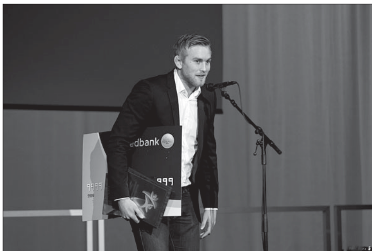
Alexander Gustafsson tackar för priset Årets kampsportare på Kampsportsgalan 2011.

Det gick väl hyfsat och efter ett tag provade jag på MMA i tävlingsform också.