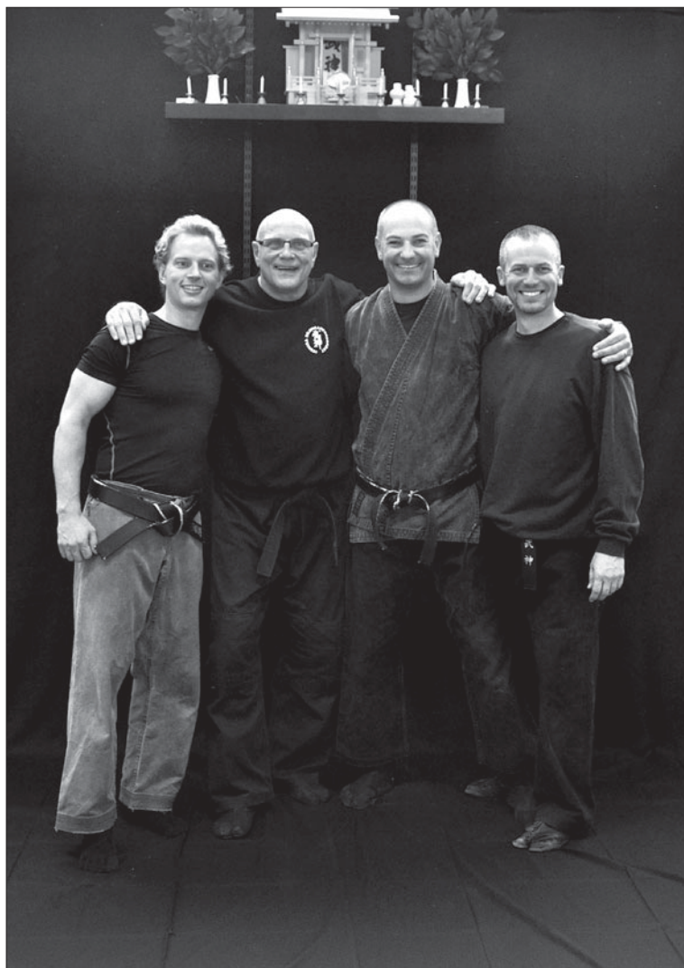
Instruktörerna vid höstens läger i bujinkan.