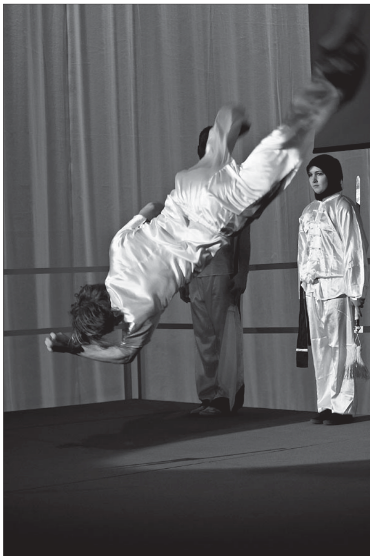
Wushuoppvisning på Kampsportsgalan 2011.