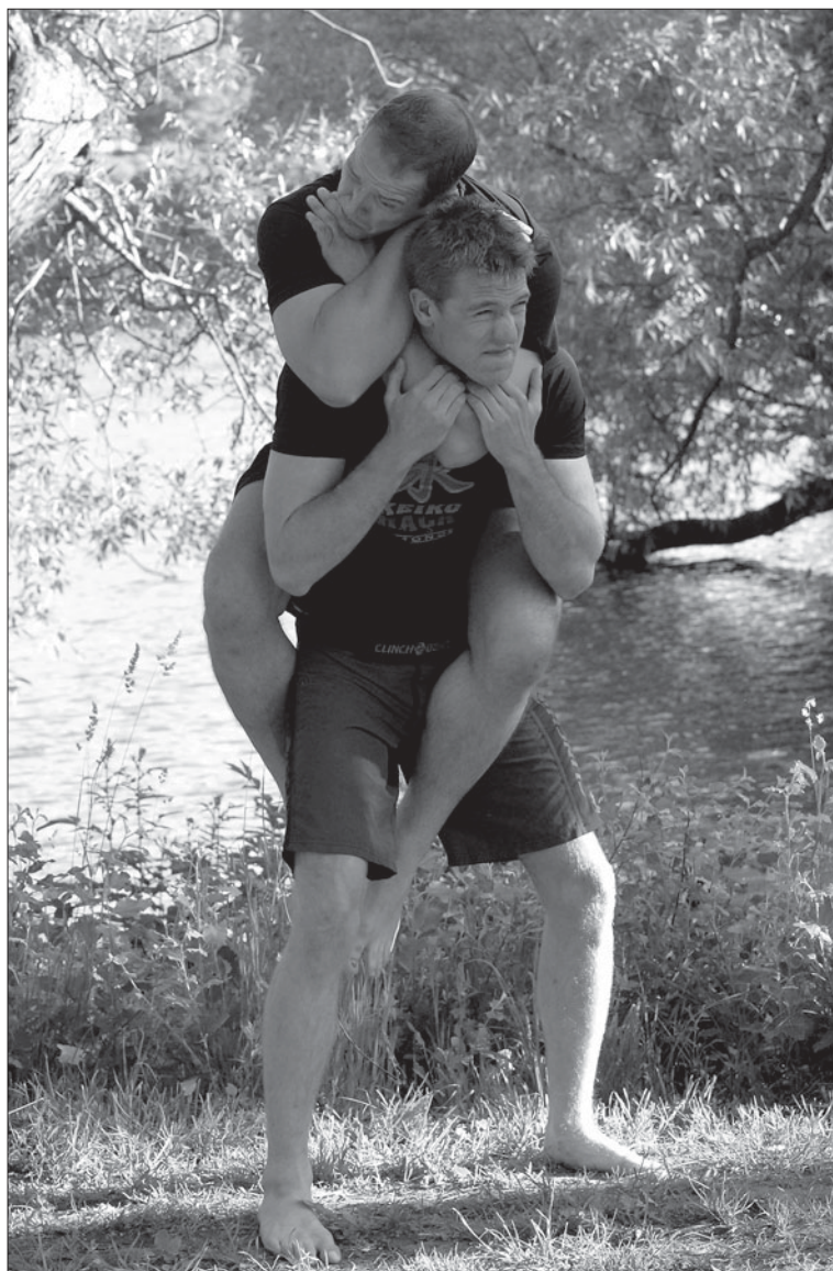
Submission wrestling.