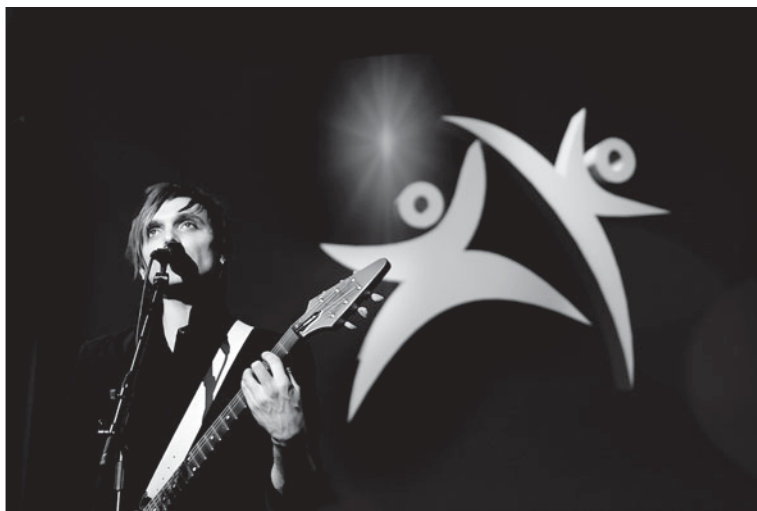
Moto Boy uppträder på Kampsportsgalan.