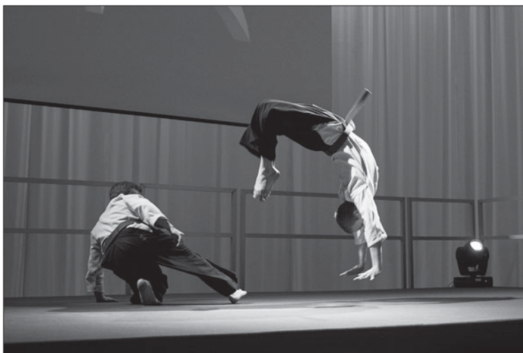
Uppvisning i taïdo på Kampsportsgalan 2012.