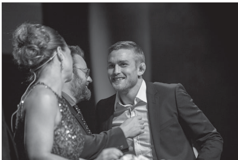
Alexander Gustafsson tar emot priset Årets kampsportare av Adam Alsing på Kampsportsgalan 2013.