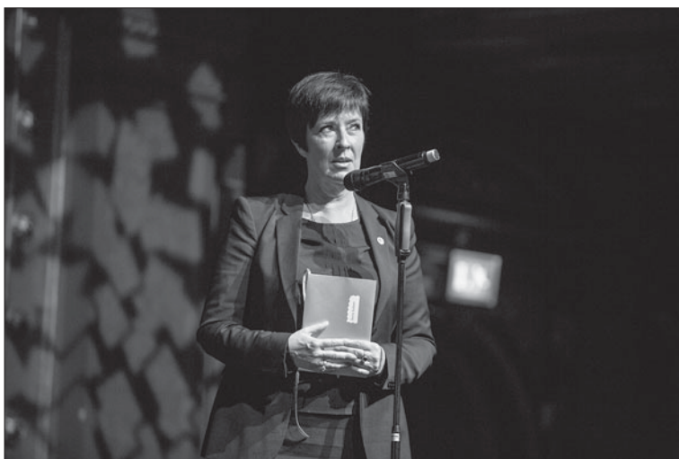
Mona Sahlin, en av prisutdelarna på Kampsportsgalan 2013.