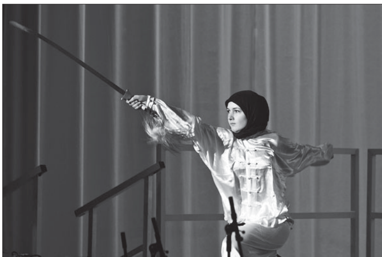
Uppvisning i wushu på Kampsportsgalan 2011.