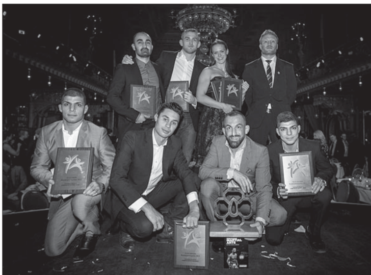
Pristagarna på Kampsportsgalan 2013.