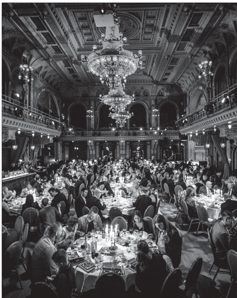
Kampsportsgalan 2013 på Berns i Stockholm.