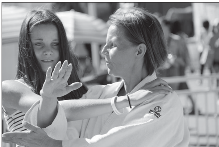
Aikido i Kungsträdgården.

aktivitet. Hon hoppas vidare på sikt att aikidon fortsätter att synas bland folkmassor.