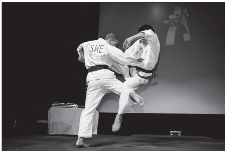
Uppvisning i jujutsu på Kampsportsgalan 2010.