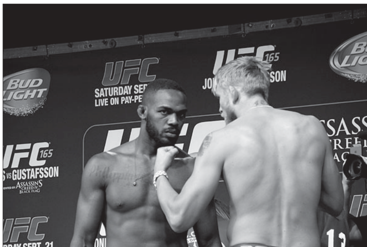
Jon Jones och Alexander Gustafsson i "stare down" före matchen i Toronto.

2) Det skulle vara det absolut största som hänt i Sveriges kampsportshistoria.