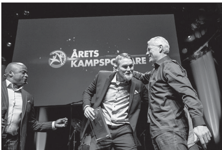
Årets kampsportare Alexander Gustafsson i nappatag med prisutdelaren Glenn Hysén på Kampspportsgalan 2014.