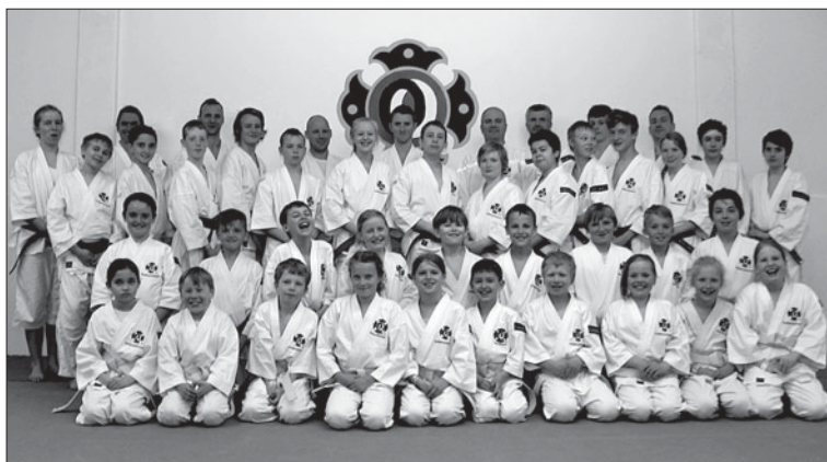
Deltagarna i träningslägret för barn i Göteborg.