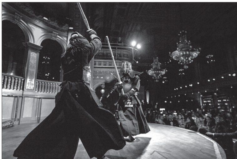
Kendouppvisning på Kampsportsgalan 2014.