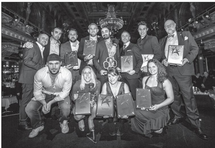
Vinnarna på Kampsportsgalan 2014.