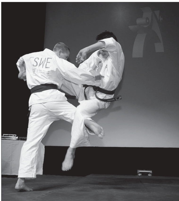
Uppvisning i jujutsu på Kampsportsgalan 2010.

2014 avverkades även sju landslagsläger totalt. Två var i kamp (ett av dem, i Holland, var ett rent judoläger, men även med fokus på fysiken), de andra två lägren hölls av juniorer och seniorer tillsammans. Dessutom: två öppna duo-läger, ett rent ne waza-läger och två läger där alla i landslaget tränade tillsammans.