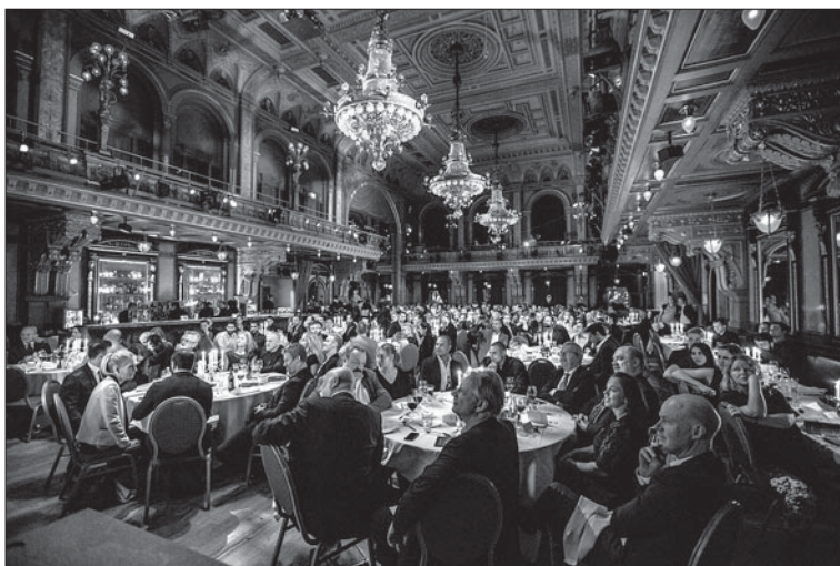
Kampspportsgalan 2014 på Berns i Stockholm.