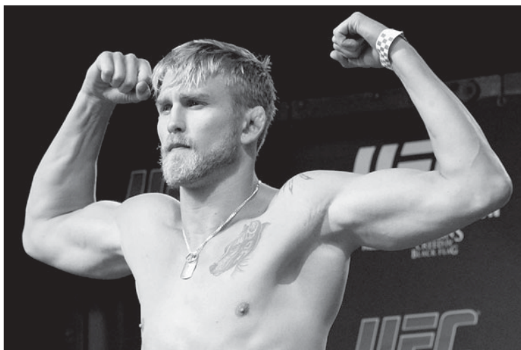
Alexander Gustafsson vid invägningen till UFC i London.

Jag minns fortfarande Torontomatchen där Jones avslappnat och lojt sänkte sin guard i lite överlägsen stil. Pang! Pang!