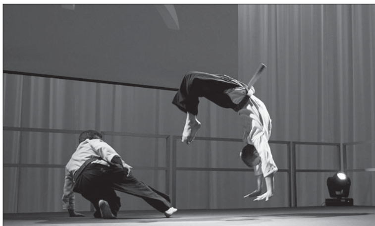
Uppvisning i taido på Kampsportsgalan 2012.