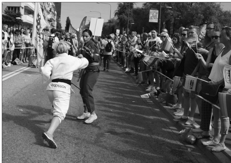
SB&K i Prideparaden.