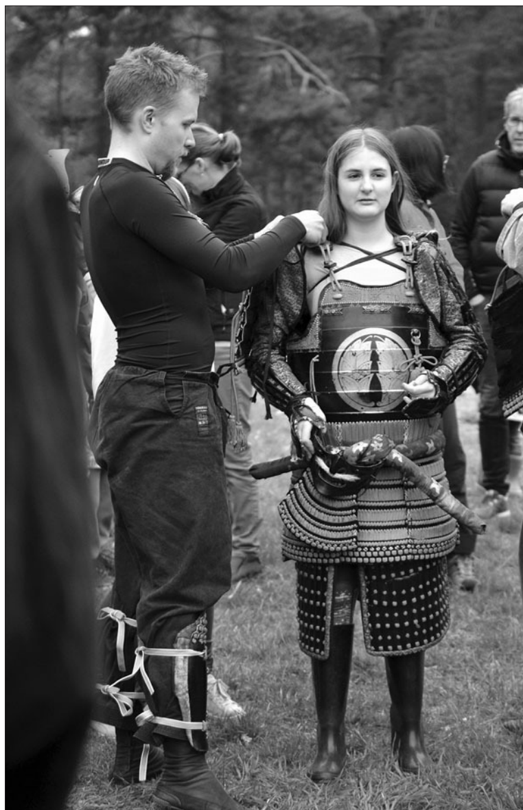
IF Bujinkan Dojo Norrköping håller uppvisning för Japanska föreningen i Östergötland.