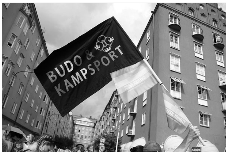
SB&K:s fana i Prideparaden, dagen till ära med bokstäver i regnbågsfärgerna.