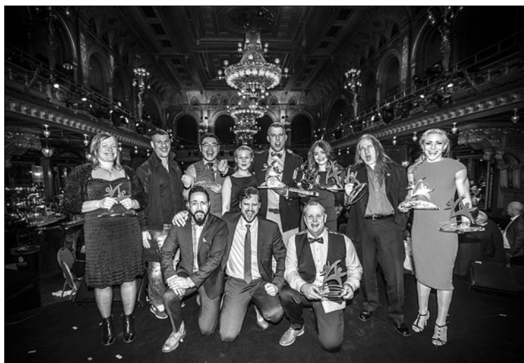
Pristagarna på Kampsportsgalan 2016.