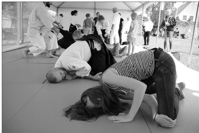
Lektion i aikidons fallteknik i Almedalen.