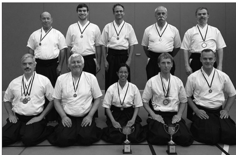
Medaljörerna vid SM i kyudo.