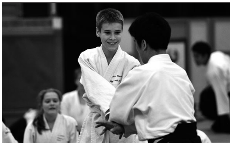
Aikido Hombu Dojo-cho Mitsuteru Ueshiba visar teknik med en av de många ungdomarna på jubileumslägret.

drog i gång aikidon i Sverige är fortfarande aktiva idag och vi ska vara oerhört tacksamma och stolta för deras arbete som tagit oss och svensk aikido hit. Det här jubileet är för hela vår gemenskap.