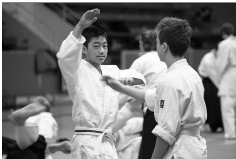
Aikidoträning på läger i Järfälla.