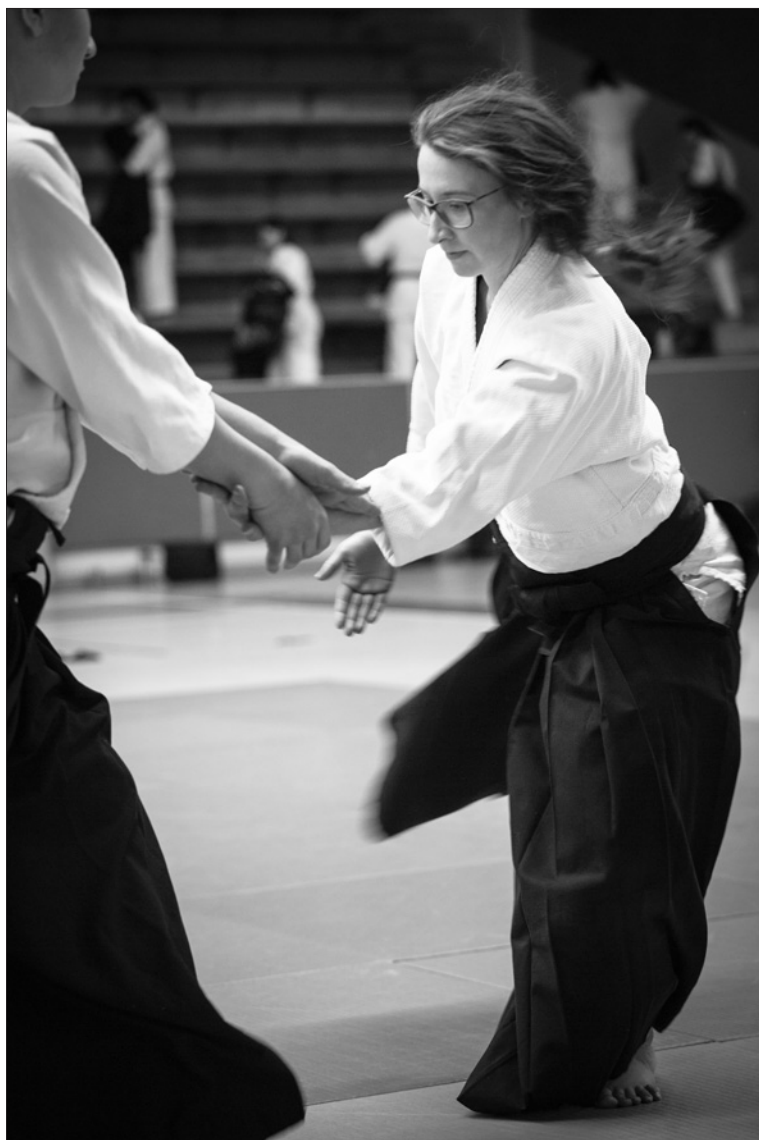
Aikidoträning på läger i Järfälla.