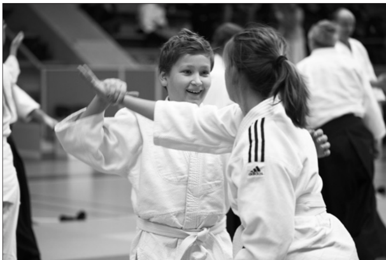
Aikidoträning på läger i Järfälla.