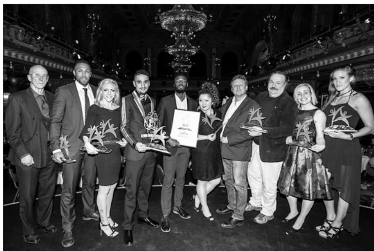
Pristagarna på Kampsportsgalan 2017.