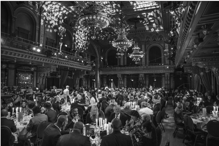
Kampsportsgalan 2018 på Berns i Stockholm.