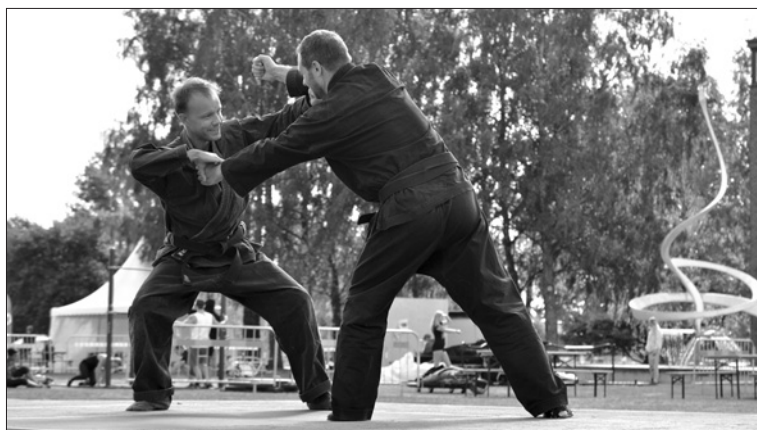
Augustifesten, Norrköping.