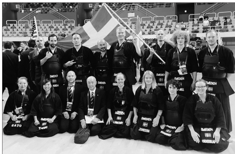
Svenska kendolandslaget på VM 2018.