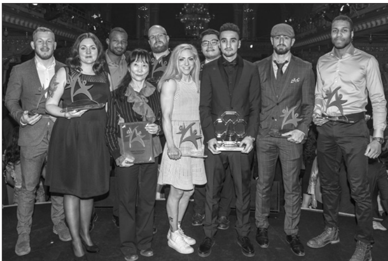
Pristagarna på Kampsportsgalan 2018. Foto: Hamid Ershad Sarabi.