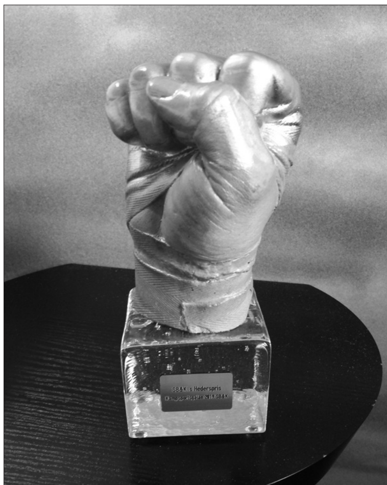
Kampsportsgalans nya prisstatyett, framtagen av Graffitisthlm.

kan peta i. Sedan går vi ihop och jobbar med Graffitisthlm, och då jobbar vi efter kunden. Så vi tar helt enkelt våra egna tekniker och kunskaper och skapar utifrån kundens vilja. Det kan vara allt från husfasader som reklamuppdrag till fotorealistiska grejer på Astrid Lindgrens museum till, ja, budo- och kampsportsstatyetter.