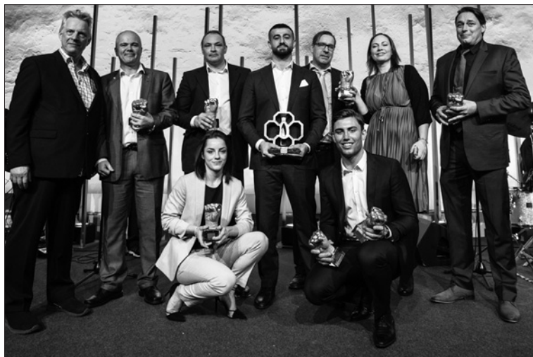
Pristagarna på Kampsportsgalan 2019.