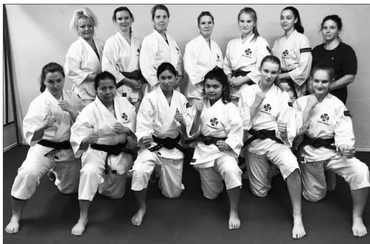
Tjejläger i shorinji kempo.