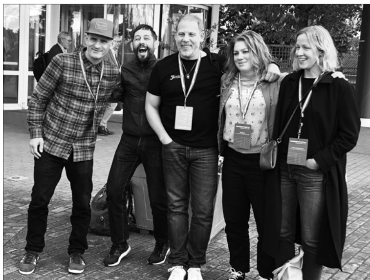
SB&K:s ombud till RIM.

Samtliga förslag till åtgärder för ett förstärkt arbete med trygg idrott fastställdes. Bland annat innebär det att personer i föreningen som anställs eller erhåller uppdrag som innebär direkt eller regelbunden kontakt med barn ska visa upp ett utdrag ur belastningsregistret.