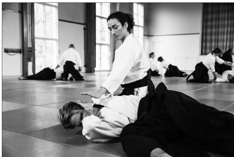
Inspelning av aikidofilm i Lillsved, oktober 2020.