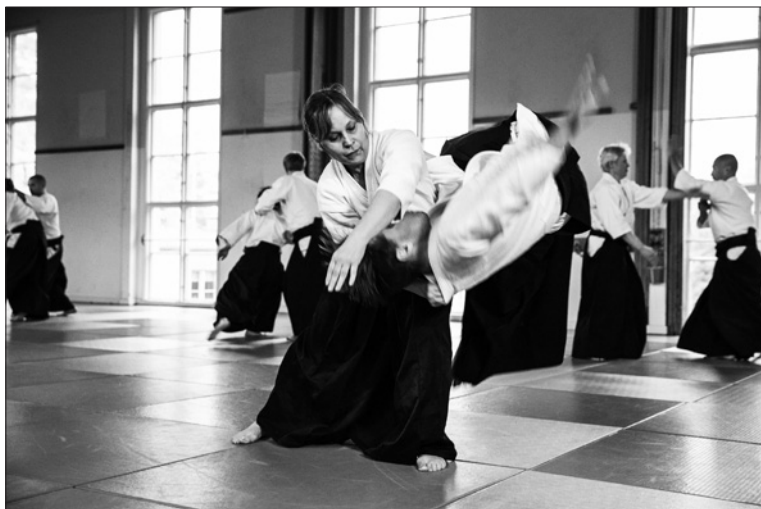
Inspelning av aikidofilm i Lillsved, oktober 2020.