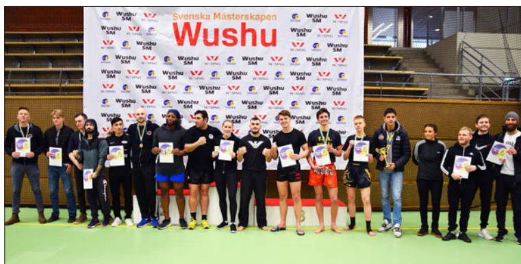
Deltagarna på SM i wushu den 29 februari 2020.