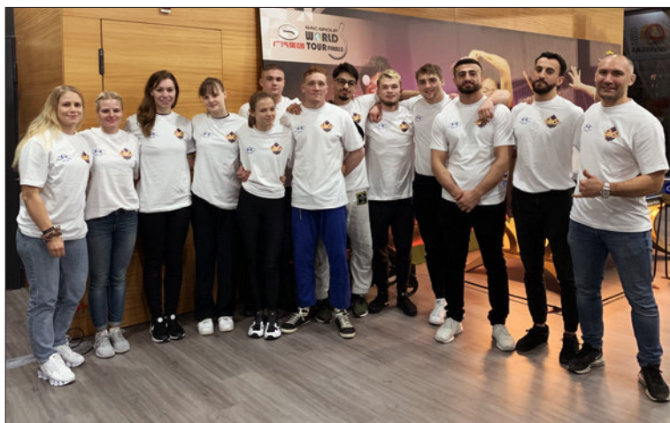
BJJ-landslaget på EM i Lissabon, Portugal, januari 2020.