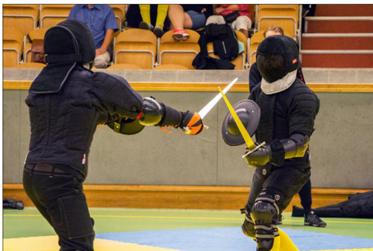
Fäktare i grenen "svärd och bucklare" från SM 2018.