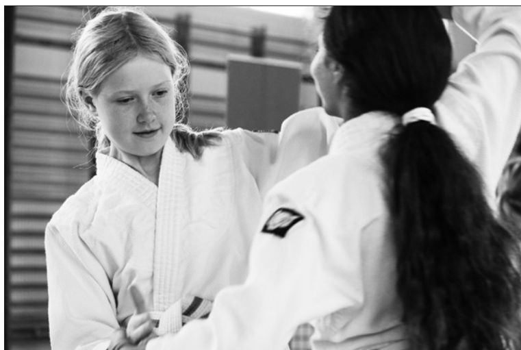
Inspelning av aikidofilm i Lillsved, oktober 2020.