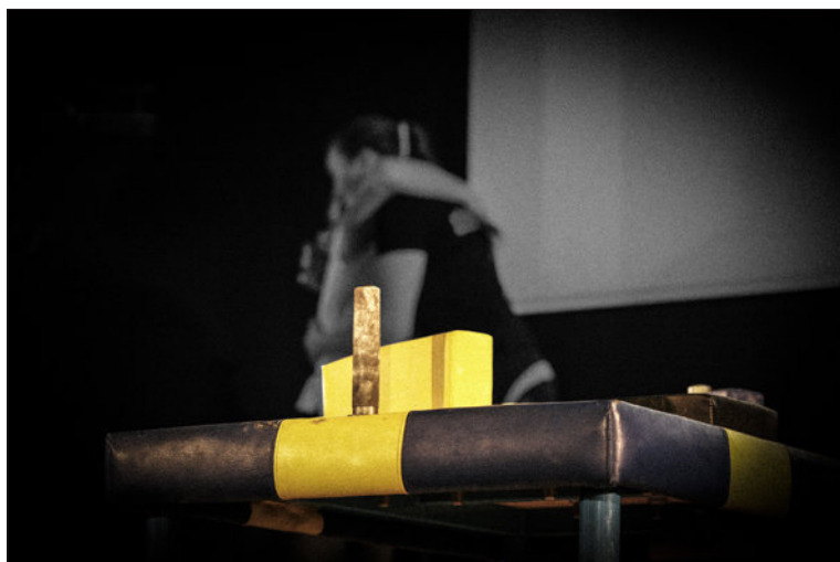
Ett öde armbrytarbord får stå som symbol för detta år.