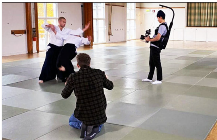
Videoinspelning.