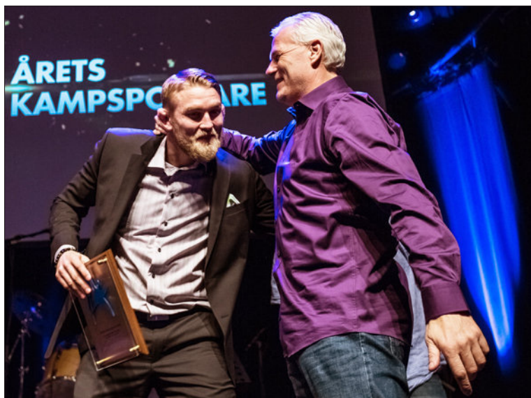
Alexander Gustafsson tampas med Glenn Hysén på Kampsportsgalan 2014.

det så varit på plats i välfyllda arenor eller framför tv-apparaterna. Bland alla våra stjärnor i förbundet, och de är sannerligen många, har du lyst allra starkast de senaste åren. Du är en stor orsak till att kampsport i allmänhet har nått allmänheten på ett sätt vi inte har upplevt tidigare. Din framfart i UFC har gjort dig till en stor idrottspersonlighet. Samtidigt har du hela tiden behållit ödmjukheten och fötterna på Jorden. Du är en otrolig ambassadör för våra idrotter. Och din betydelse för svensk budo och kampsport överlag är monumental.