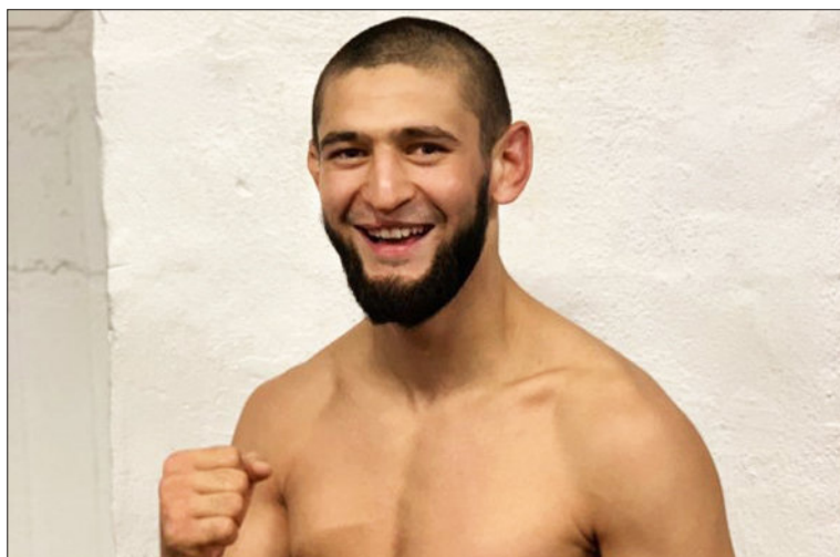
Khamzat Chimaev. Arkivbild.

den digitala Kampsportsgalan blev MMA-fightern utnämnd till Årets genombrott för sina framgångar.