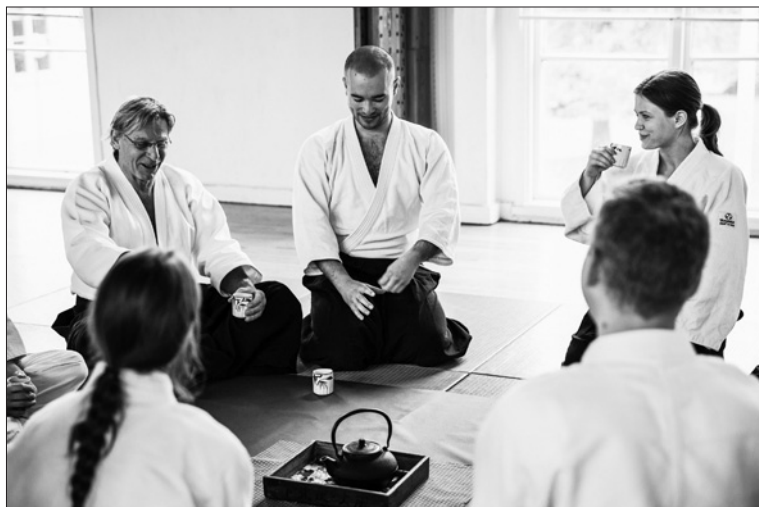
Inspelning av aikidofilm i Lillsved, oktober 2020.